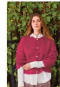
DEBUTANT CARDIGAN Tynn Silk Mohair x2 Design 3