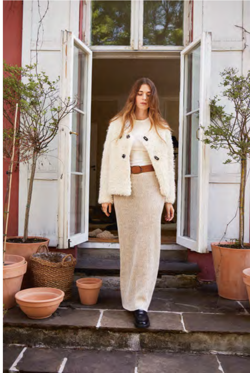
2308 | BØRSTET ALPAKKA | 4½ | 16 | 10 | AYA JACKET 6 | XS-3XL (nedenfra og opp)