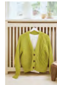
ARTISANE CARDIGAN Double Sunday + Tynn Silk Mohair Design 1