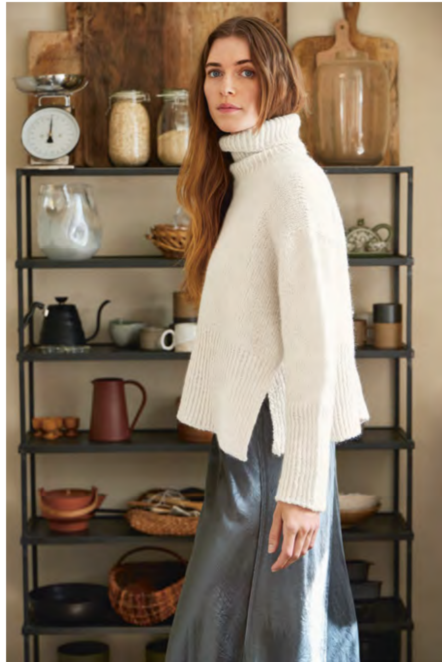
2308 | KOS | \times 4\frac{1}{2} | \frac{\text{---}}{\text{---}} 18 | 10 | ... ABBY SWEATER KOS EDITION XS-4XL (ovenfra og ned)