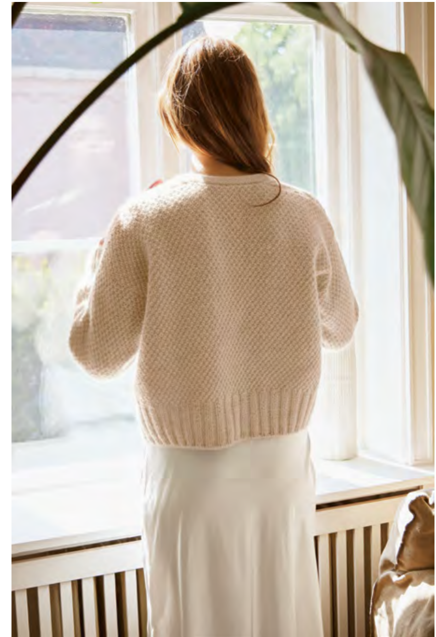
2308 | DOUBLE SUNDAY+ | X 4 1/2 | 18 | 10 | ARTISANE CARDIGAN 1 | TYNN SILK MOHAIR | XS-5XL (ovenfra og ned)