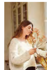
FACILE SWEATER Børstet Alpakka x2 Design 7