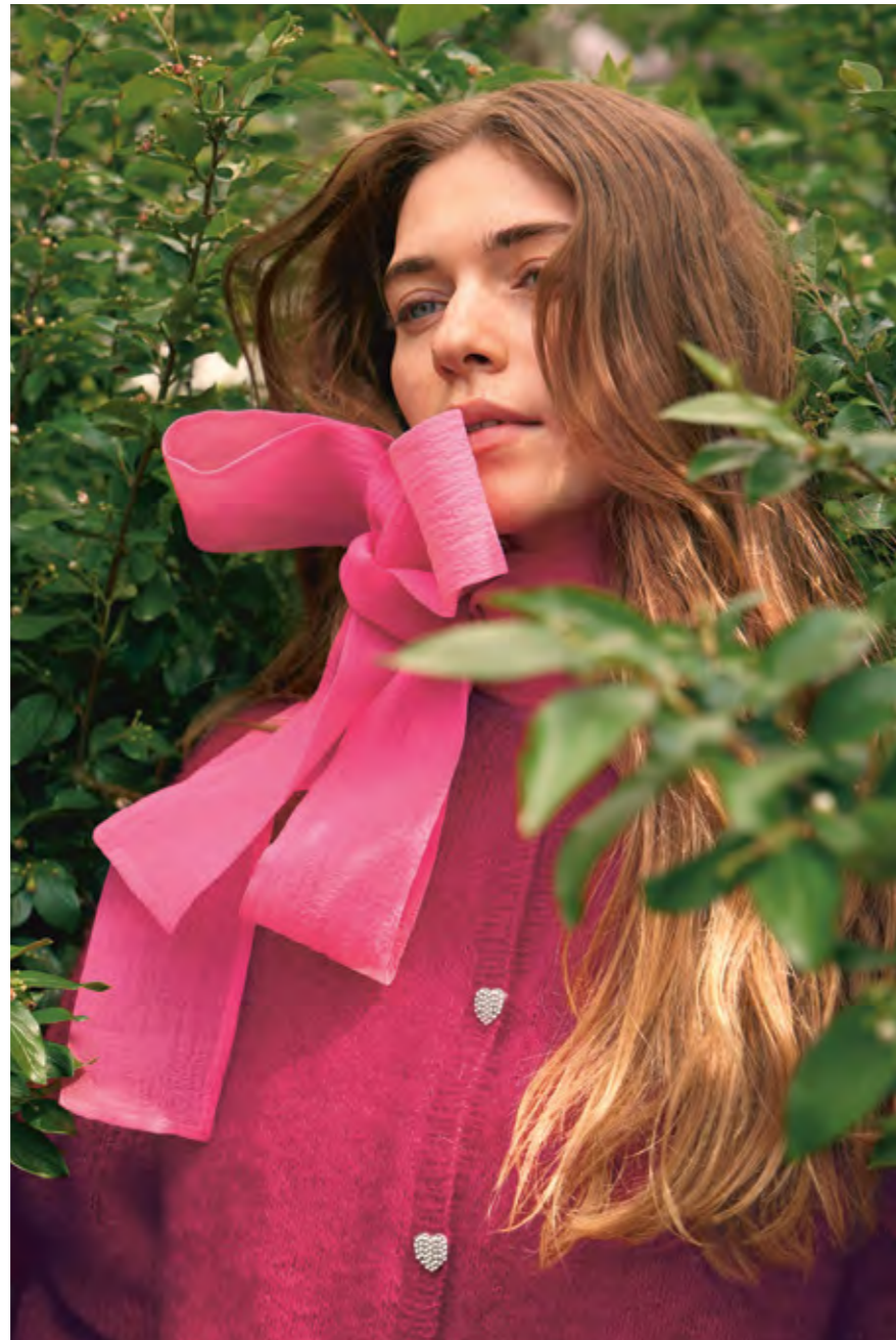
2308 | TYNN SILK MOHAIR | \times 3\frac{1}{2} | \frac{\text{---}}{22} \frac{\text{---}}{10} | •• DEBUTANT CARDIGAN 3A OG 3B | X2 | XS-5XL (ovenfra og ned) eller (nedenfra og opp)