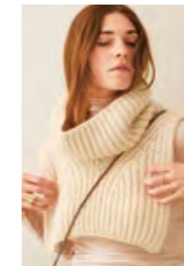
STELLA NECK Alpakka Ull + Tynn Silk Mohair Design 2