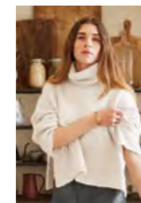
ABBY SWEATER KOS EDITION Kos Design 9

EVENTUELLE RETTELSE TIL DETTE HEFTET FINNER DU PÅ SANDNESGARN.NO