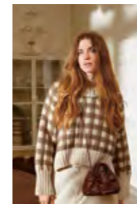
GINGHAM SWEATER Peer Gynt Design 4