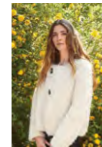
AYA JACKET Børstet Alpakka Design 6