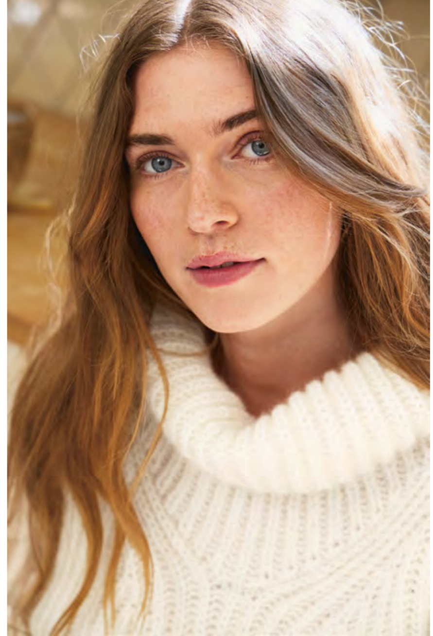
2308 | ALPAKKA ULL+ | \times 4\frac{1}{2} | \overline{\text{AAA}} | ... STELLA SWEATER 8 | TYNN SILK MOHAIR | 13 | 10 | XS-2XL (ovenfra og ned)