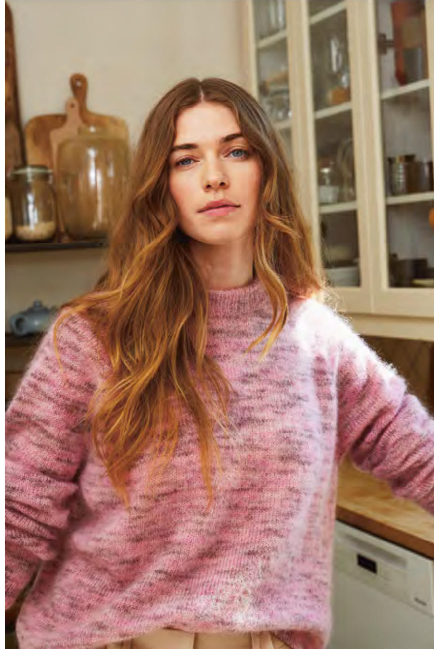
2308 | TYNN SILK MOHAIR | \times 3 1/2 | \overline{\text{A A A}} 22 | 10 | • DEBUTANT SWEATER 5A OG 5B | X2 | XS-5XL (ovenfra og ned) eller (nedenfra og opp)