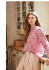
DEBUTANT SWEATER Tynn Silk Mohair x2 Design 5