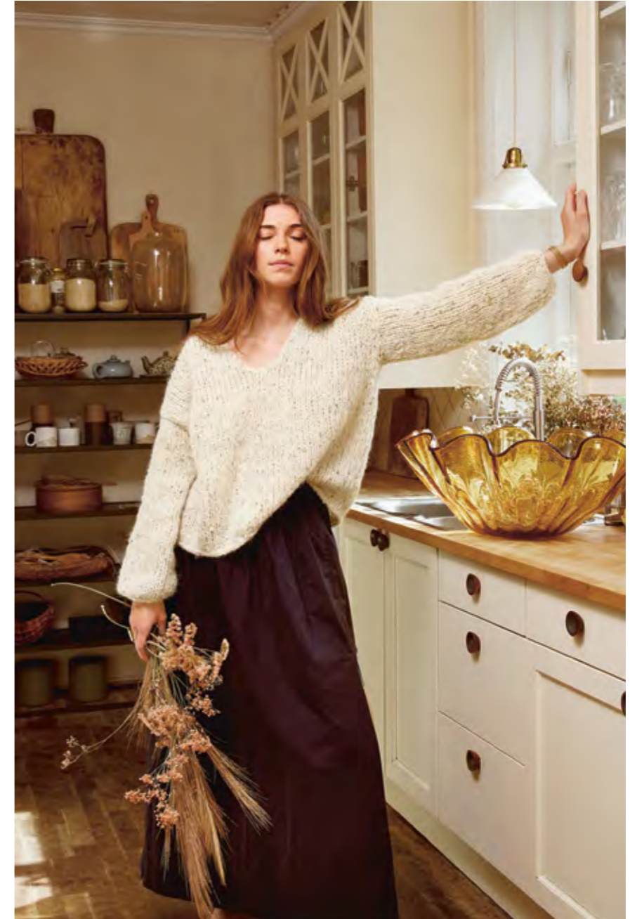
2308 | BØRSTET ALPAKKA | X 12 | 8 | 10 | • FACILE SWEATER 7 | X2 XS-5XL (ovenfra og ned)