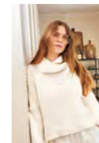
STELLA SWEATER Alpakka Ull + Tynn Silk Mohair Design 8